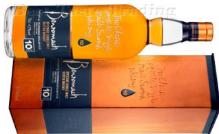
Benromach 10 Year Old

Ein sehr rauchiger Single Malt Whisky. Es werden nur sehr kleine Mengen dieses einzigartigen Benromach Speyside Whisky produziert. Für die Herstellung wurde feinste schottische Gerste mit einem hohen Gehalt an Torfrauch von 57ppm gemälzt und das Destillat in 100% Bourbon Fässern gereift. Das Resultat ist ein ausgeprägt rauchiger Single Malt, doch mit der charakteristischen Eleganz und Fruchtigkeit eines Benromachs. Ein wunderbarer Vanilleduft steigt in die Nase, im Gaumen entfaltet sich der gemahlene Pfeffer mit süsser Erdbeer- und Orangenaromen, kombiniert mit langanhaltender Lagerfeuerasche. Der Whisky endet wunderbar mit langen Zigarrenaromen.