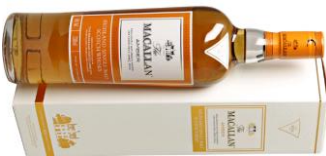
Macallan Single Malt Amber

Ein mehrfach preisgekrönter Single Malt, in Handarbeit hergestellt in der kleinsten Destillerie der Speyside. Gelagert in den besten Sherry & Bourbon Fässern, wird er fürs Finishing in süssen Oloroso-Fässern fertiggestellt. Im Gaumen schöne Waldfrüchte und Himbeeren, mit Sherry, cremig nach Malz und ausgeprägten Torfnoten. Ein lang nachklingendes Finish mit feinen Sherry- & Torfnoten macht Spass!